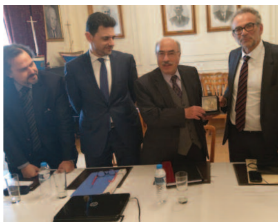
Στιγμιότυπα από την επίσκεψη του Προέδρου του Αρείου Πάγου κ. Βασίλη Πέππα στο ΔΣΠ