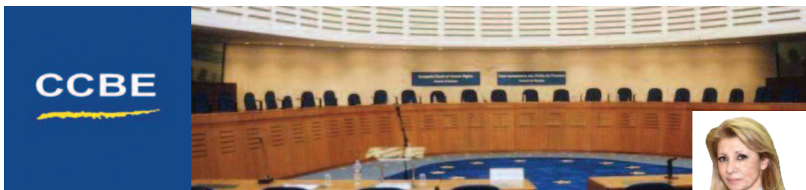
Της Μάϊρης Φλωροπούλου-Μακρή τ. Αντιπροέδρου ΔΣΠ